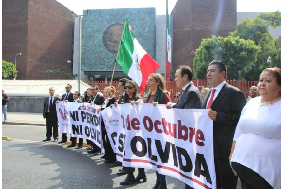
Marcha del Silencio 2 de octubre no se olvida