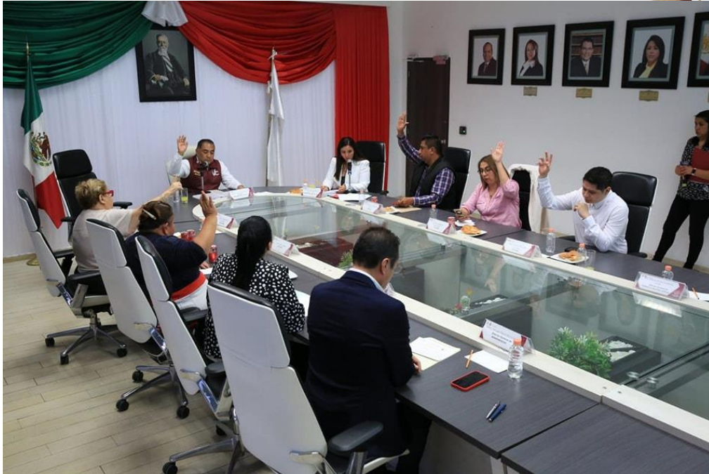
5ta. Sesión Extraordinaria del Concejo de la Alcaldía Venustiano Carranza