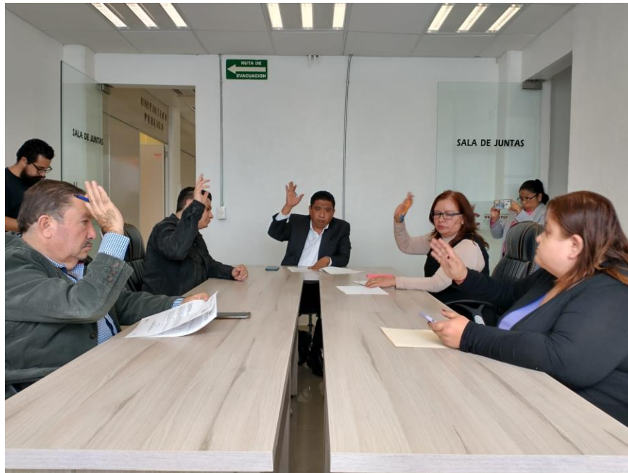
Décima Octava Sesión Ordinaria de la Comisión de Pueblos y Barrios Originarios, y Comunidades Indígenas