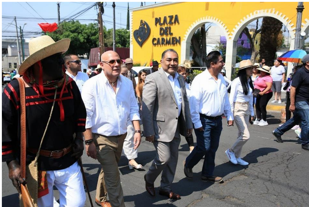
Representación de la Batalla de Puebla de 1862 en el Pueblo del Peñón de los Baños