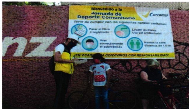
Promover el programa Becarranza y la vacuna contra influenza.