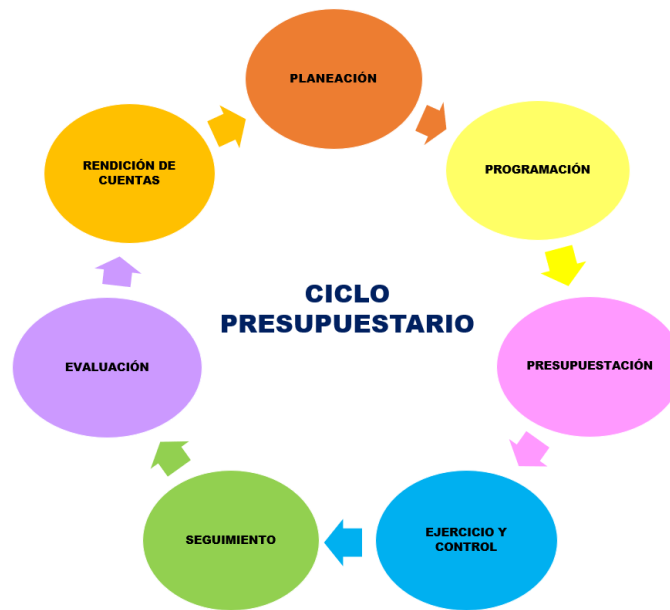
Figura 2.- El Ciclo Presupuestario